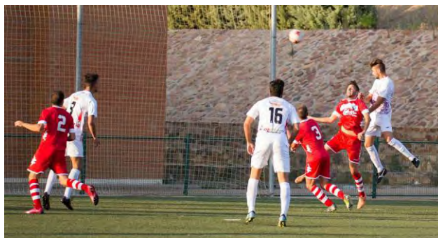
Imagen del debut del Aceuchal en 3ª.

Este primer tropiezo, no impedirá al equipo seguir trabajando para lograr el objetivo, que no es otro según su entrenador Cisqui, que “salvar la categoría”, y después “soñar”.